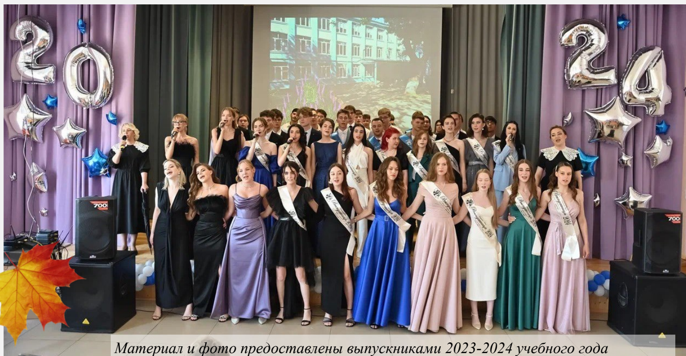
Материал и фото предоставлены выпускниками 2023-2024 учебного года